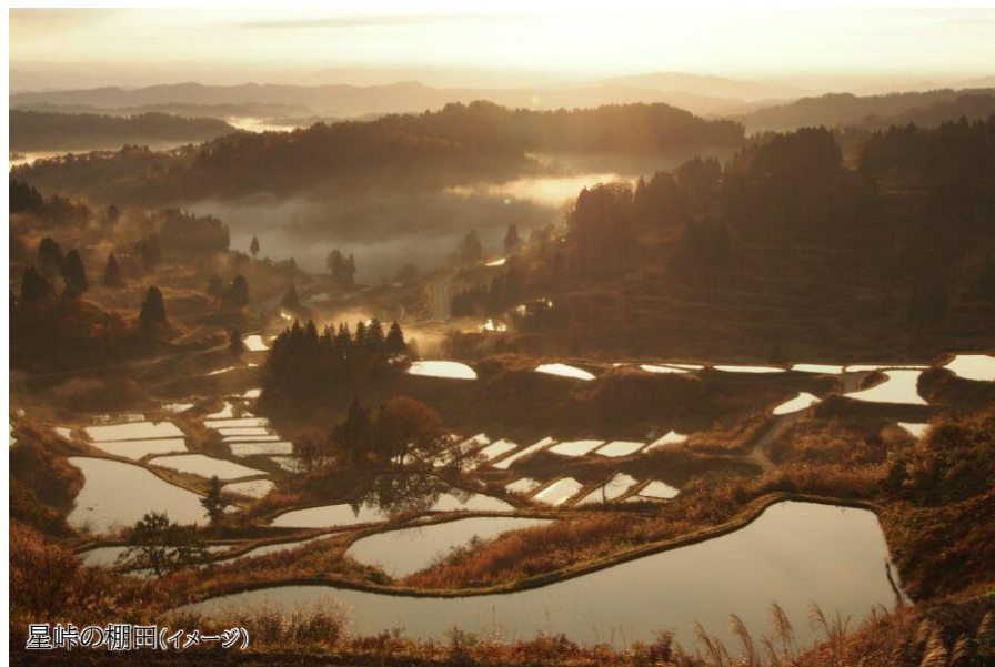
星峠の棚田(イメージ)