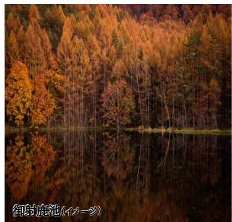
御射鹿池(イメージ)