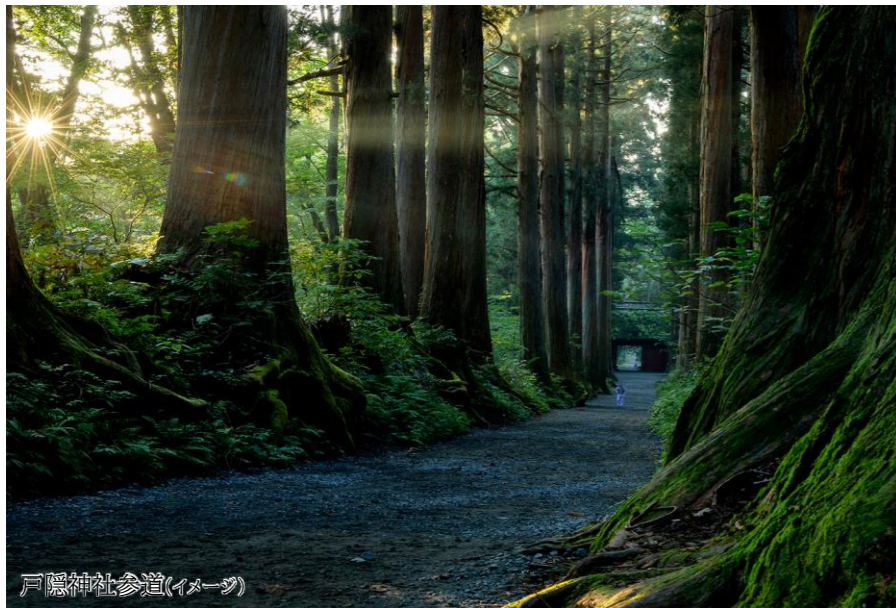
戸隠神社参道(イメージ)

ご旅行期間とご旅行代金 2023年 11月2日(木)発～11月7日(火)着…¥292,000 お一人部屋利用追加料金 ¥39,000